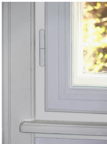
Bontás nélkül felújított ablak

Néhány cég ezzel próbálja csalogatni a vevőket, hogy az ablakcsere nem jár bontással, nincsenek utólagos munkák. Nézzünk erre egy példát: ha a régi faablak tokjára építik rá az új ablakot, akkor az ablakfelület kisebb lesz, és fennáll annak a veszélye, hogy több hő szivárog át, mintha a munkát rendesen elvégeznénk. Ezenkívül fennáll a veszélye, hogy hőhíd keletkezik, ami ront a szigetelési tulajdonságokon. Bontás ide, vagy oda érdemes a nyílászárócserét rendesen elvégezni.